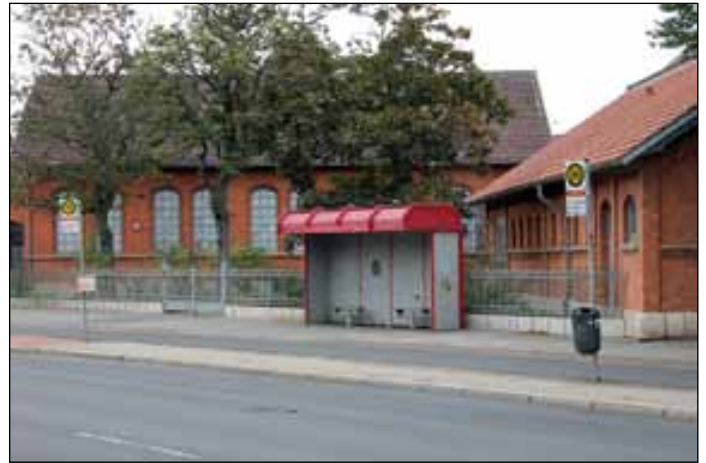
Die Haltestelle Campestraße wird 2013 modernisiert.