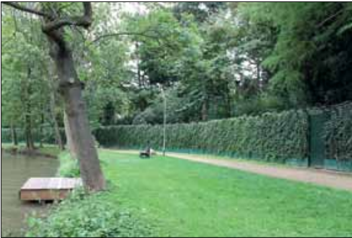
Bootssteg in Rimpaus Garten.