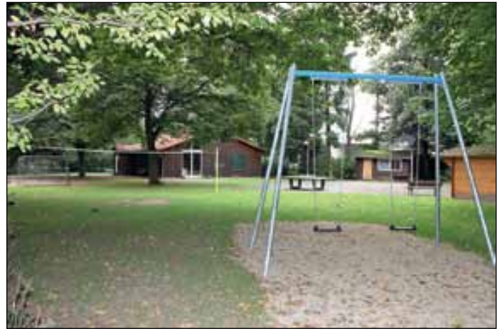
Außengelände des Kinder- und Jugendzentrums im Bebelhof.