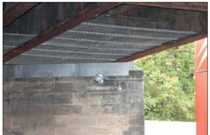
Gitter unter den Brücken an der Salzdahlumer Straße.