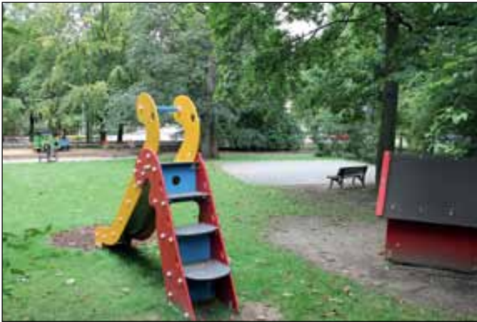
Spielplatz in Viewegs Garten an der Ottmerstraße.