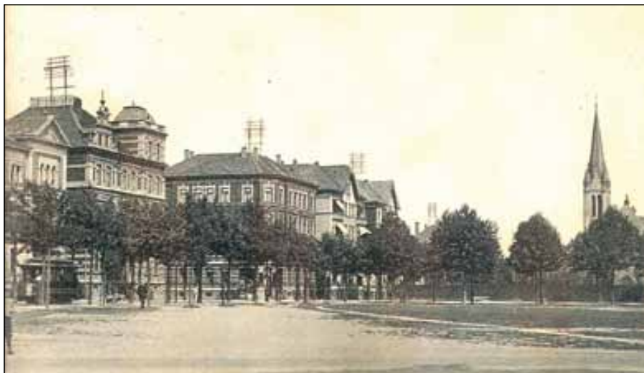
Leonhardplatz mit St. Johannis (1911).

Im Braunschweigischen Adressbuch von 1877 finden wir Wilhelm Raabe, wohnhaft in der Salzdhahmer Straße 3. Heute ist das